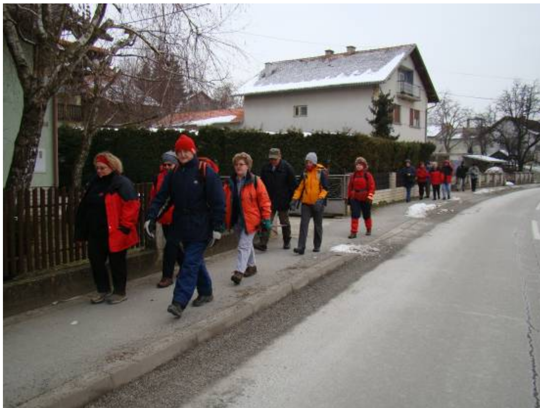
Planinarenje je krenulo iz Adamovca ...

Opisao i snimio: Vladimir Beštak, planinski vodič