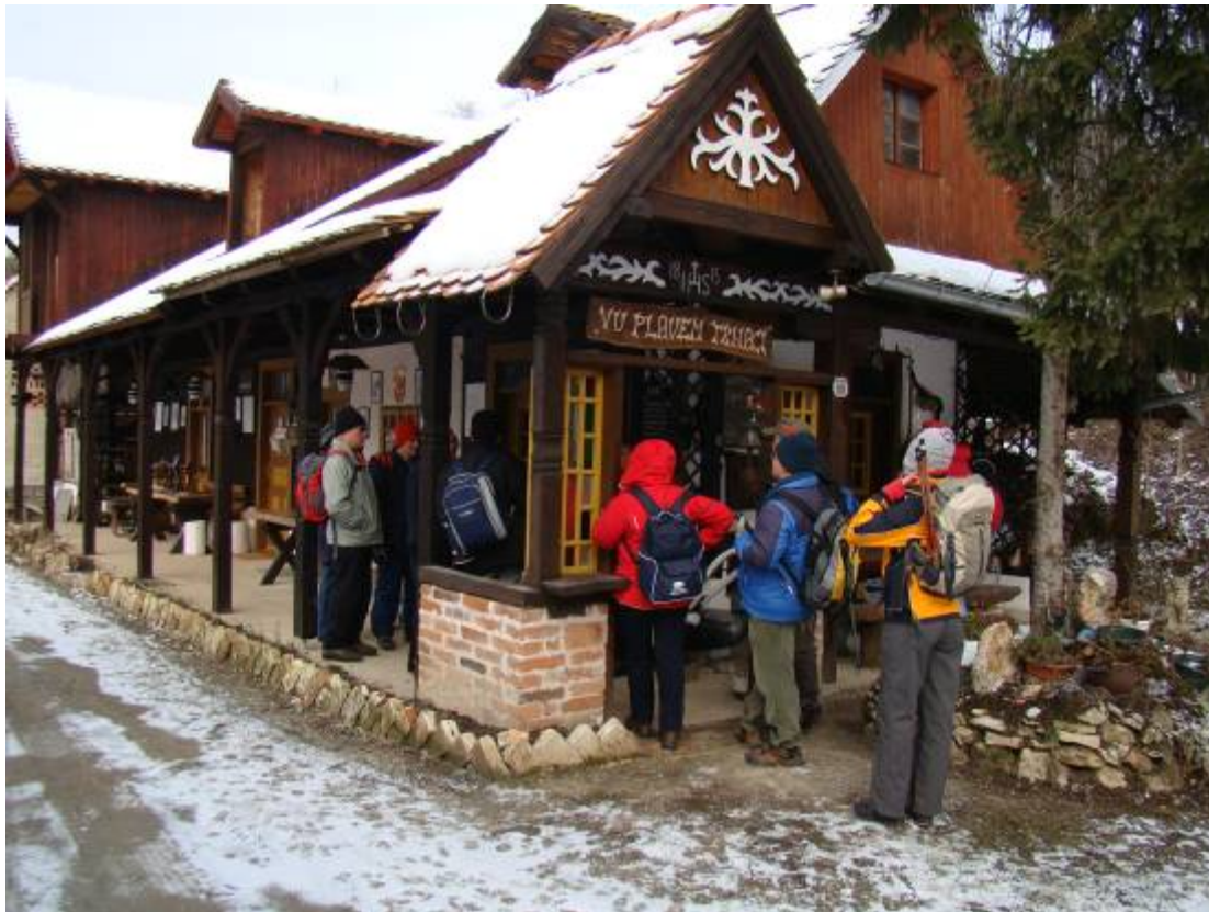
Etnografski objekt Zlatka Strugara