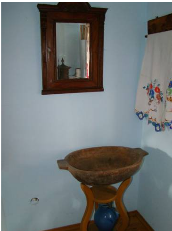
Dio sačuvanog tradicijskog blaga