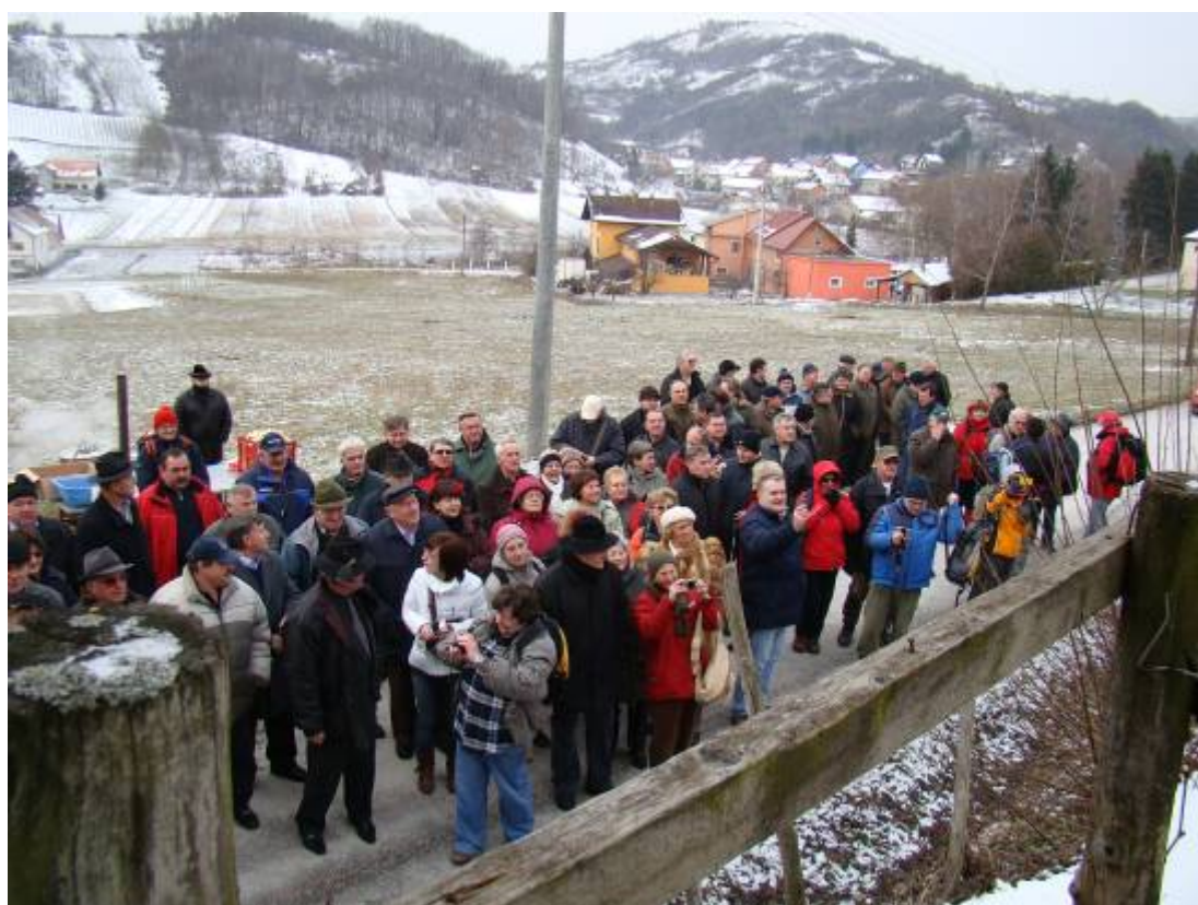
Posjetitelji napeto prate program