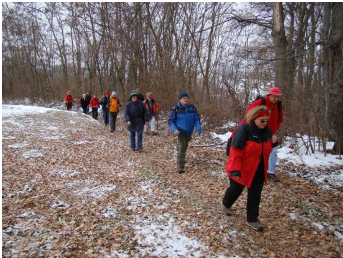
... a nastavilo se uz šumu ...