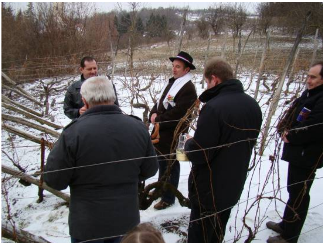
Sve je spremno za zalijevanje vinom