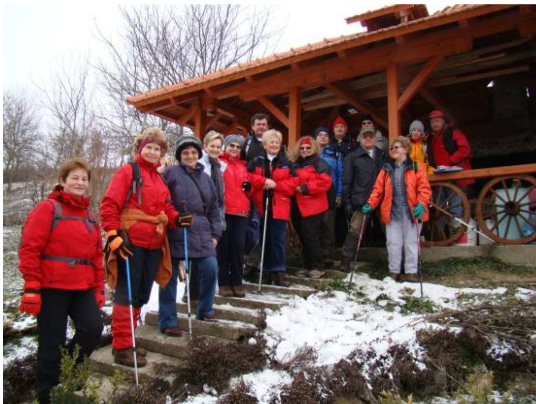
Kod Dragičine klijeti